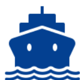
Tavola rotonda e business meeting fra comandanti, cantieri, fornitori e stakeholder del comparto super yacht.